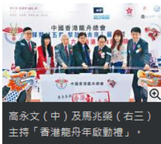
高永文（中）及馬兆榮（右三）主持「香港龍舟年啟動禮」。

【星島日報報道】受到尖沙嘴星光大道海濱工程影響，今年四十周年的「香港國際龍舟邀請賽」將由尖東首度移師中環新海濱舉行，赛道由中環九號碼頭至灣仔會展對出的維港海面。中國香港龍舟總會表示，中環新海濱延伸至添馬公園的海傍空間更闊，舉辦龍舟嘉年華的規模更大，可容納更多市民欣賞賽事。今年更特別邀請漁民隊伍參加「大龍邀請賽」，以及國際頂級優勝隊伍來港參賽，刺激度倍增。